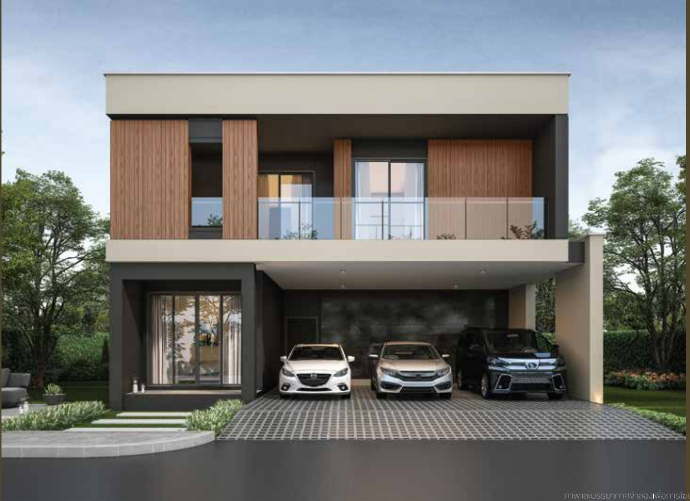
ภาพและบรรยากาศจำลองเพื่อการโฆษณาเท่านั้น